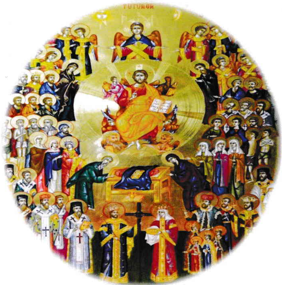
Icoana „Adunarea tuturor sfinților”